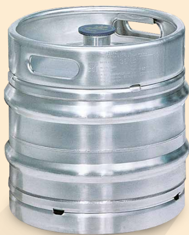
30 l Keg-Fass Art.-Nr.: 5242