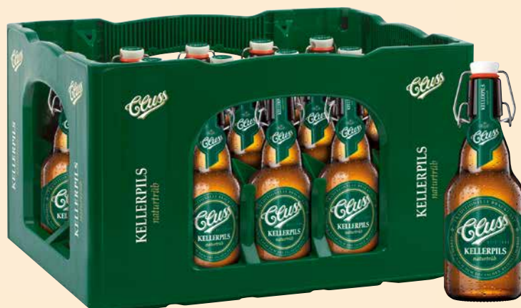
20 x 0,33 l Kasten Art.-Nr.: 5255