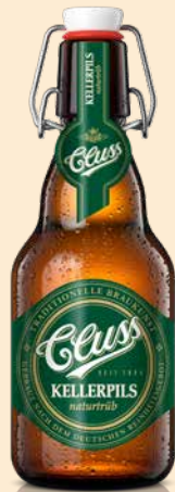
0,33 l MW-Flasche