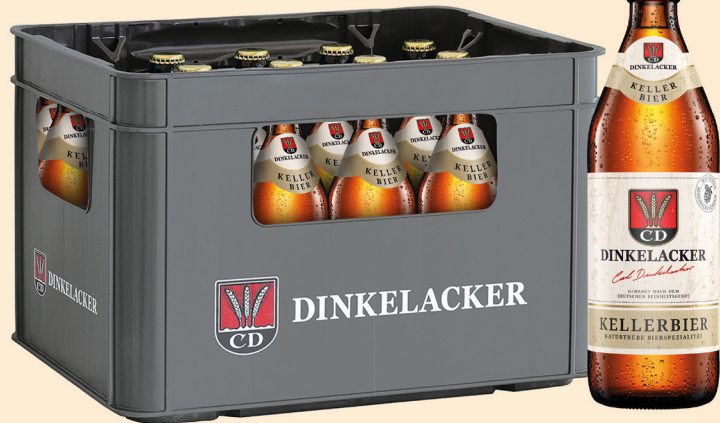
20 x 0,5 l Kasten, Art.-Nr. 5056