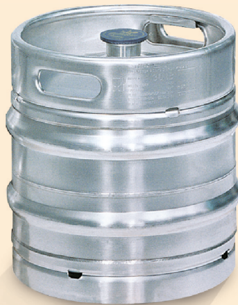
30 l Keg-Fass, Art.-Nr.: 5210